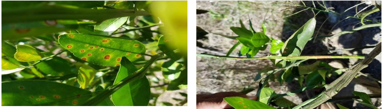
Figura 3. Exploración para detección de síntomas de Leprosis

No se detectaron otros síntomas de enfermedades de Interés cuarentenario.