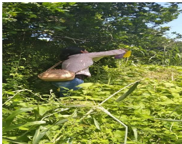
Figura 2. Trampas establecidas para el monitoreo del PAC.

El promedio de diaforinas obtenido en el mes de octubre fue de 0.937 diaforinas/trampa/mes.