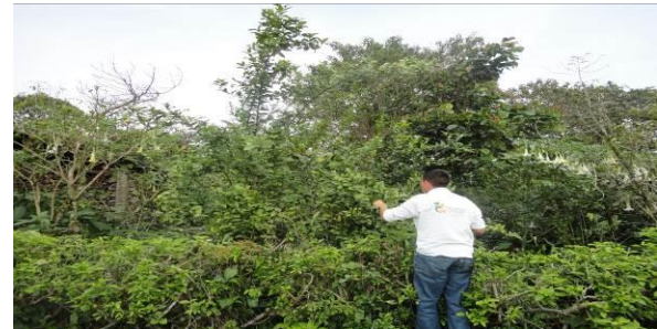
Figura 7. Toma de muestras de psílicos en rutas urbanas

d) Control químico. Con respecto al control químico este se llevó a cabo en 5,640.00 ha correspondientes a las AMEFI 01- Fco. Z. Mena y 03- Acateno. Esta actividad se realizó a fin de disminuir las poblaciones de diaforina y evitar daños a la brotación de este periodo.