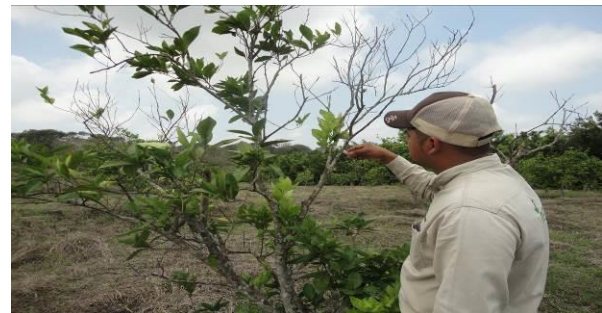
Figura 6. Toma de muestras de psílicos en huertas comerciales