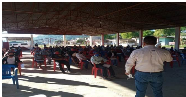
Figura 9. Talleres participativos a productores sobre síntomas de plagas reglamentadas de los cítricos y control de diáforina

f) Entrenamiento: Con el propósito de difundir la estrategia operativa de la Campaña, así como la sensibilización hacia los productores sobre la importancia de las enfermedades y adopción de las acciones mediante el establecimiento de AMEFIs, se realizaron 4 Talleres Participativos en los Municipios de Fco. Z. Mena, correspondiente a la JLSV Sierra Norte; Acateno y Tenampulco, correspondientes a la JLSV Sierra Nororiental. Con esta acción se benefició un total de 394 productores.