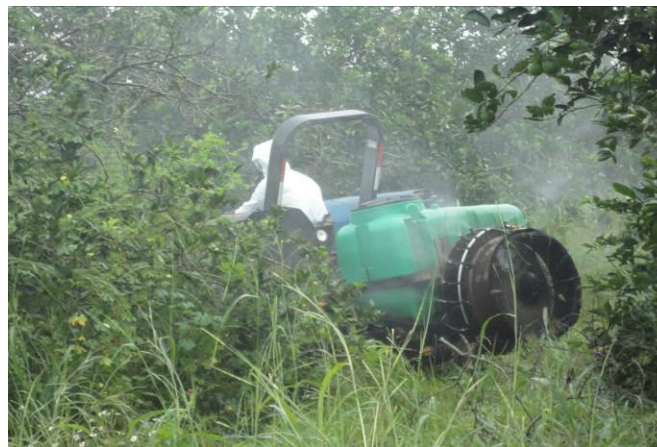
Figura 8. Control químico contra el psílido asiático de los cítricos

f) Entrenamiento: Con el propósito de difundir la estrategia operativa de la Campaña, así como la sensibilización hacia los productores sobre la importancia de las enfermedades y adopción de las acciones mediante el establecimiento de AMEFIs, se realizaron 4 Talleres Participativos en los Municipios de Fco. Z. Mena, correspondiente a la JLSV Sierra Norte; Acateno y Tenampulco, correspondientes a la JLSV Sierra Nororiental. Con esta acción se benefició un total de 394 productores.