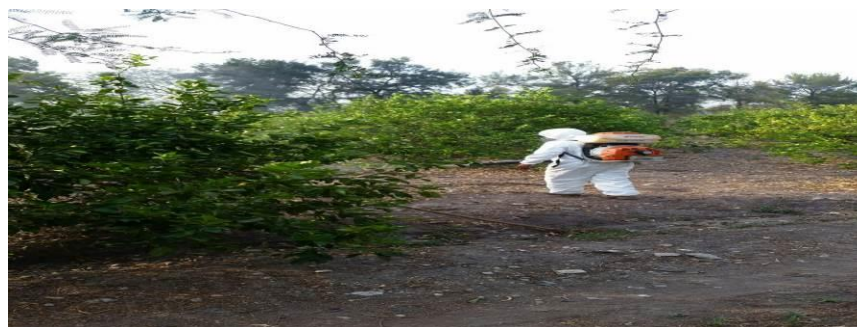
Figura 4. Seguimiento para el control de focos de infestación en Tilapa, Pue.